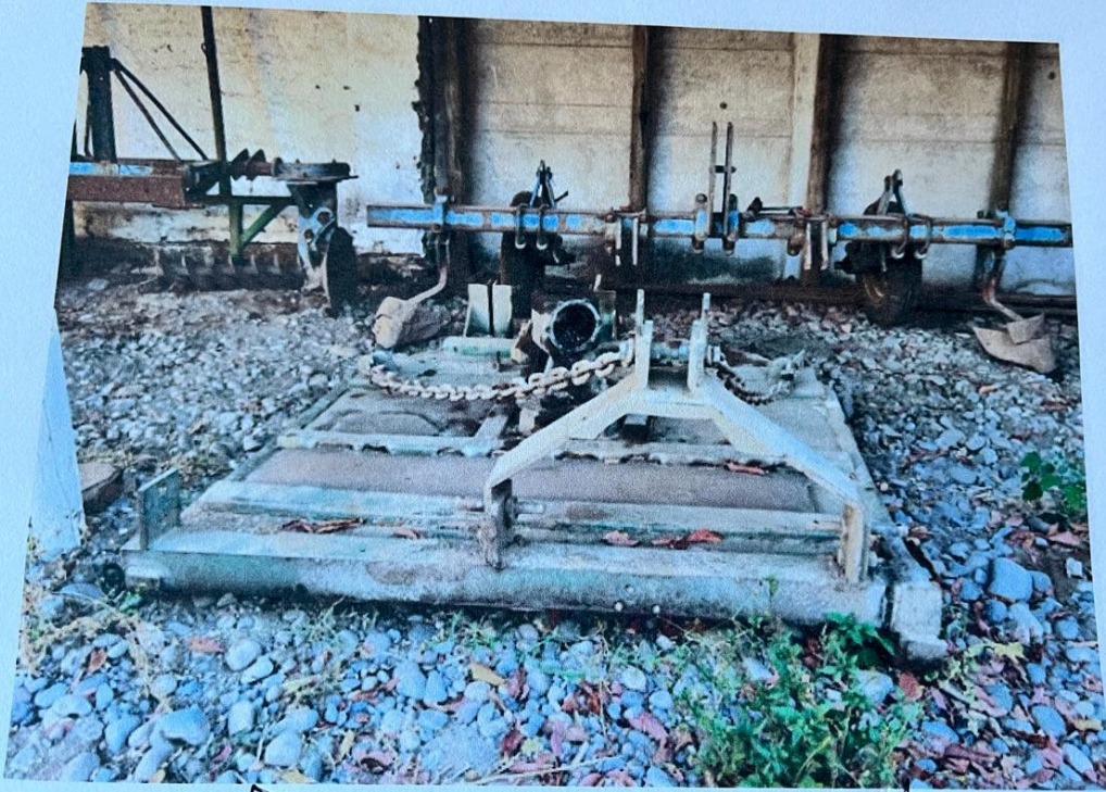
Rawa detualizadora # 1.100.000 //