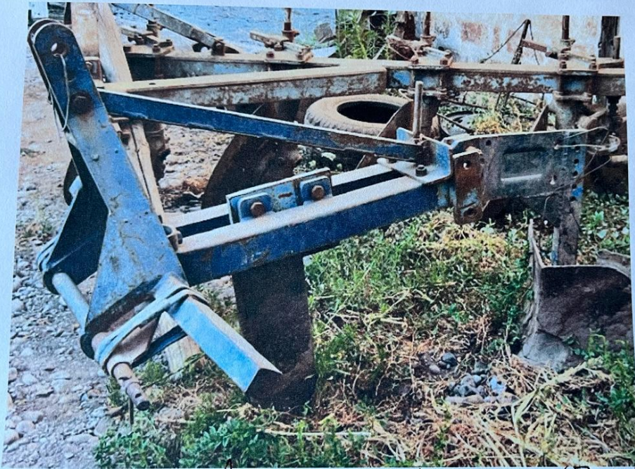
Arado sub-solador y fuzgador (Plantaciones) $ 1.000.000 //