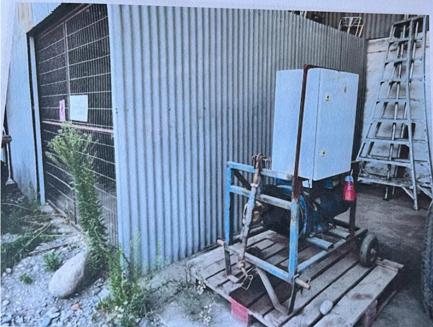
Equipo Generador 30 KVA (trifásico, monofásico) para tractor $ 2.500.000.?