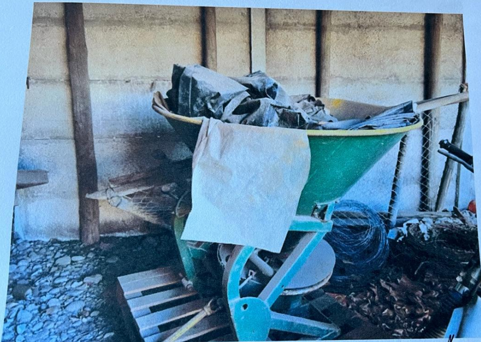
Equipo fertilizador de disco ₡ 2.400.000 "