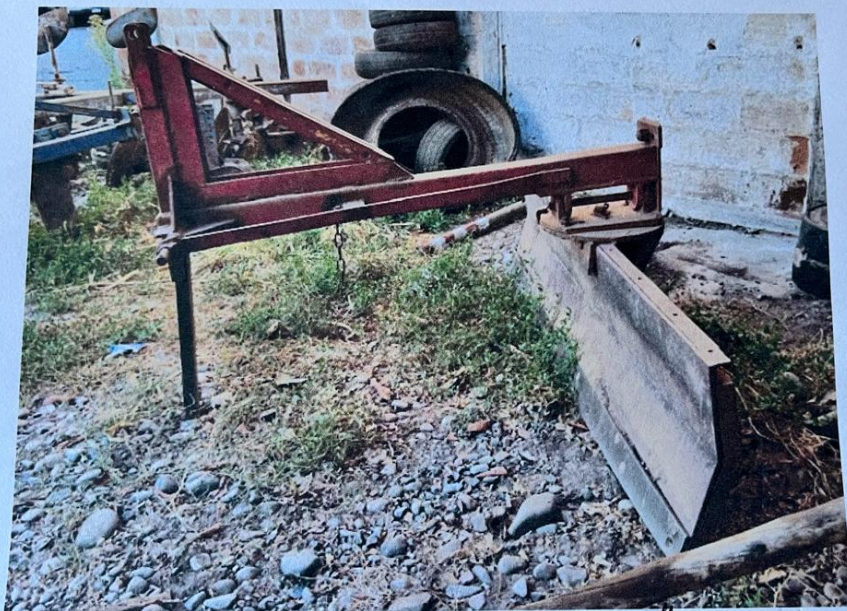
Para Cola Tractor # 1.800.000"