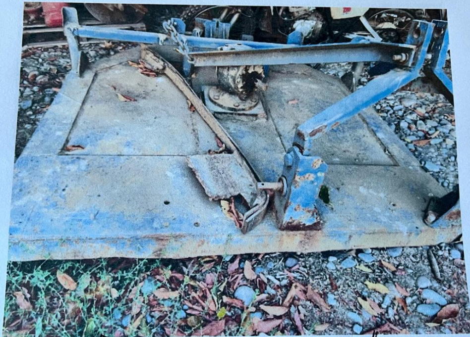
Rawa detualizadora # 1.100.000 //