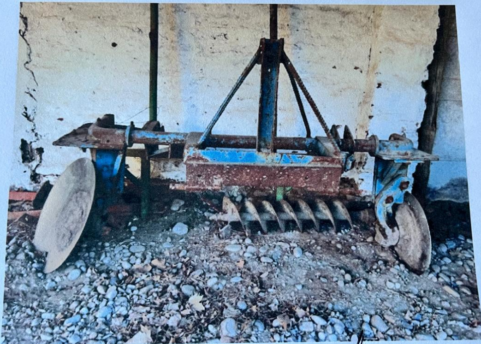
Arado Plata baidero $ 1.000.000 "