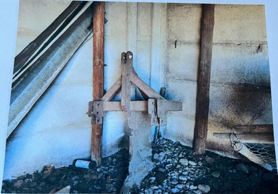
Arado sub-folador ₡ 900.000 "