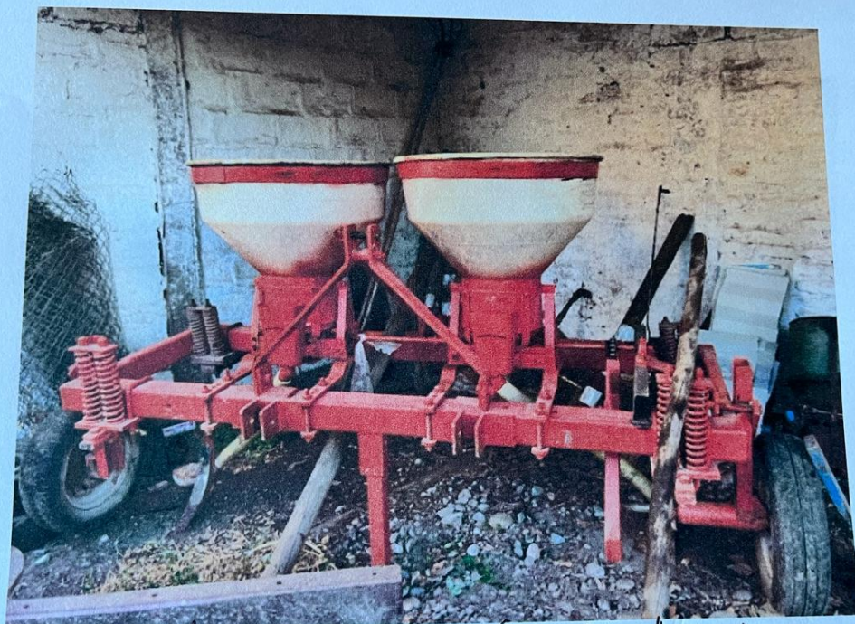
Equipo arador 2 fucos # 3.400.000"