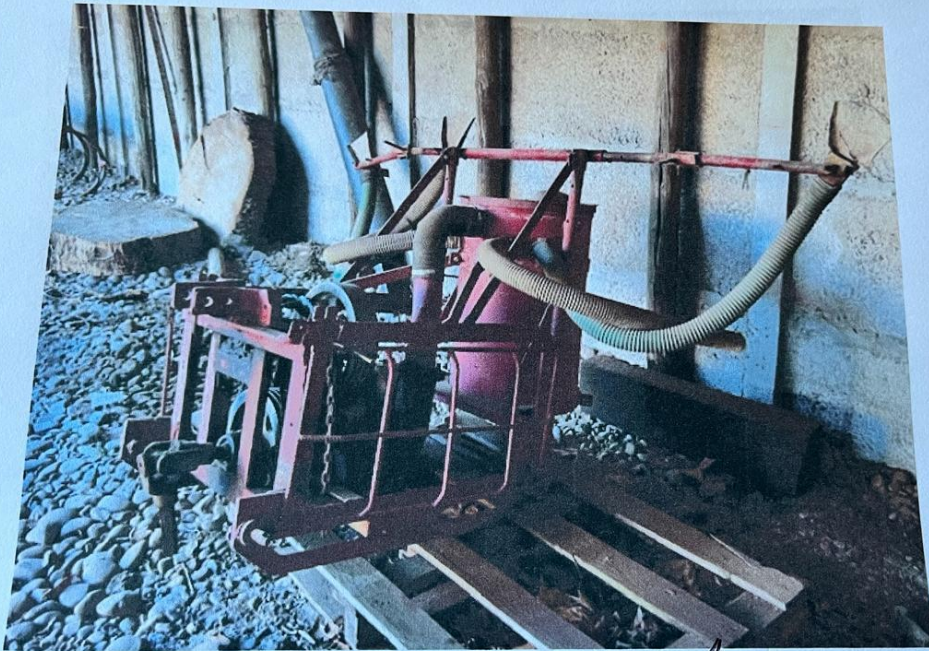
Azufadora tractor $ 1.500.000.?