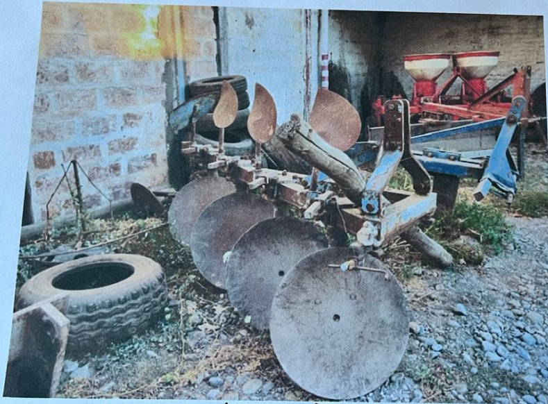
Arado 4 diten Rawson $ 2.800.000 "